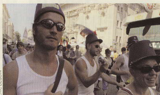
Les mobilisations de cette année (ici à Avignon en juillet dernier) ont permis de contenir les attaques contre la culture, selon le Syndeac.